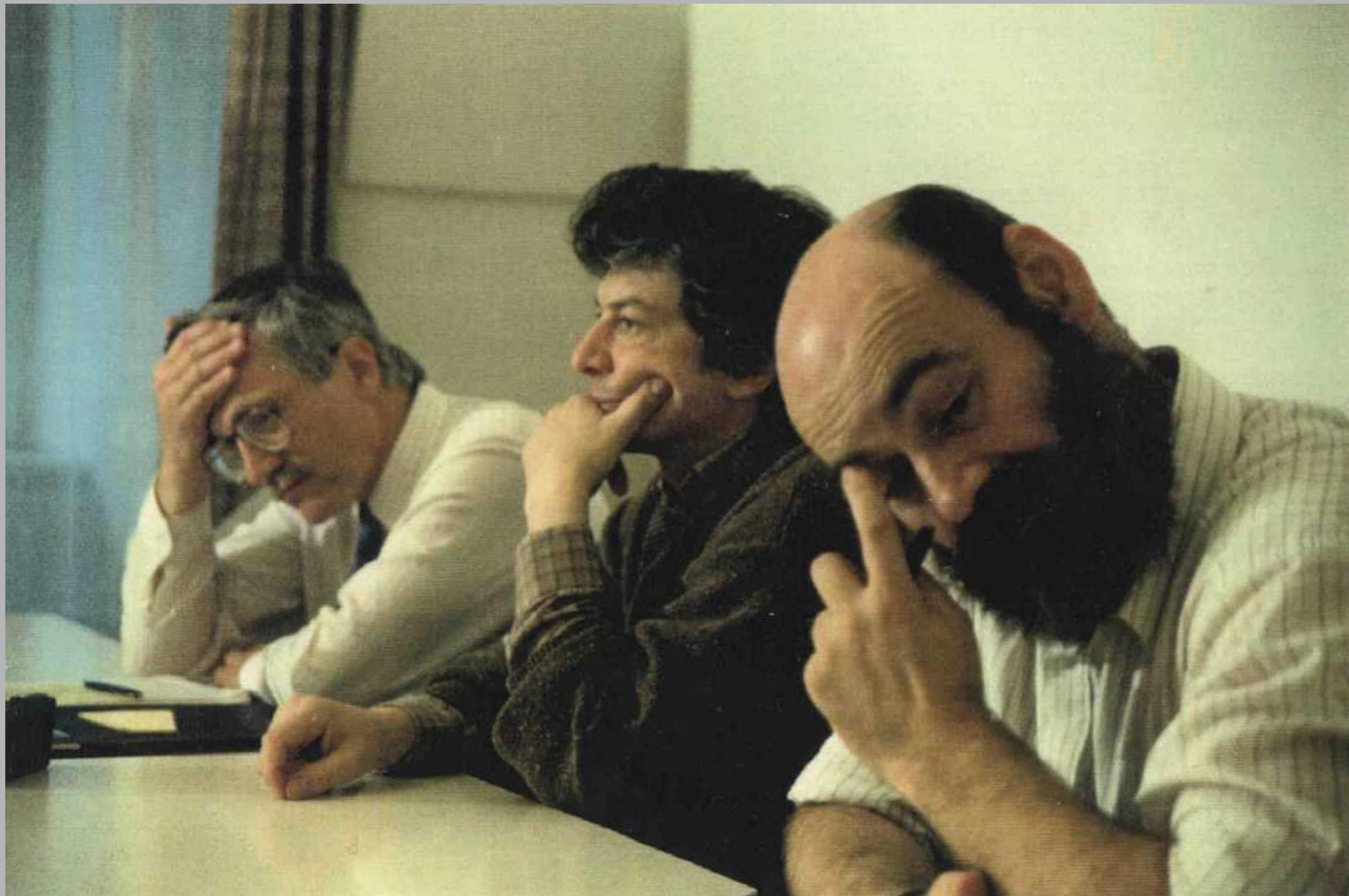
1991 Na tiskovce OF: Václav Klaus, Vladimír Železný, VS